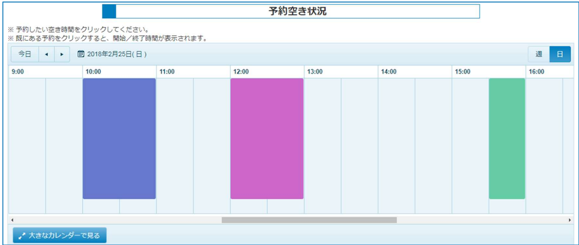
図 1.1.2-3 予約カレンダー 日表示